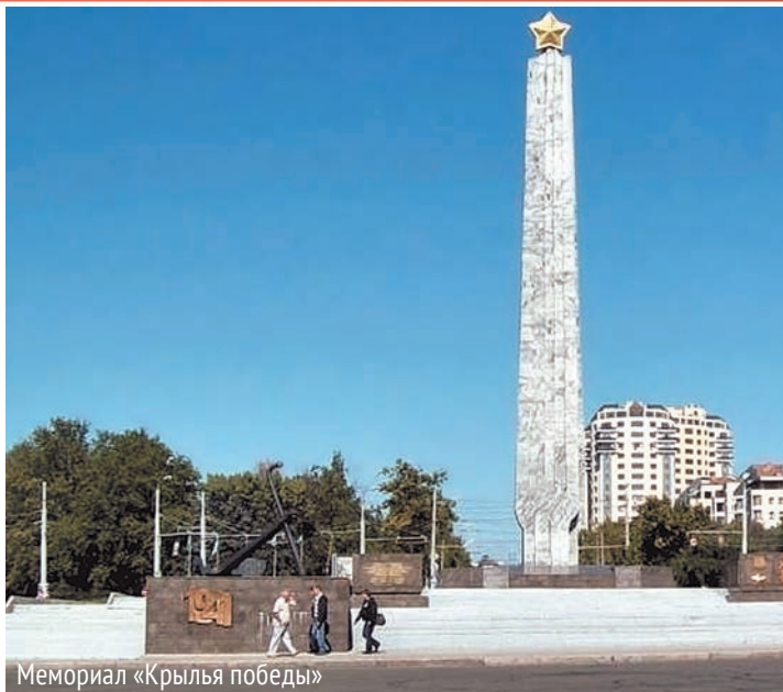
Мемориал «Крылья победы»