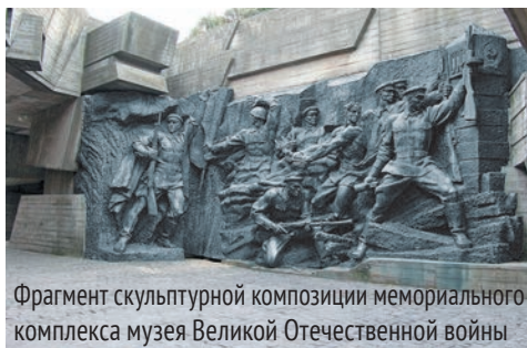
Фрагмент скульптурной композиции мемориального комплекса музея Великой Отечественной войны