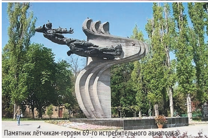
Памятник лётчикам-героям 69-го истребительного авиаполка