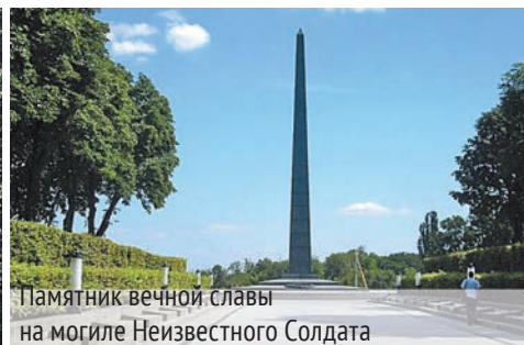
Памятник вечной славы на могиле Неизвестного Солдата