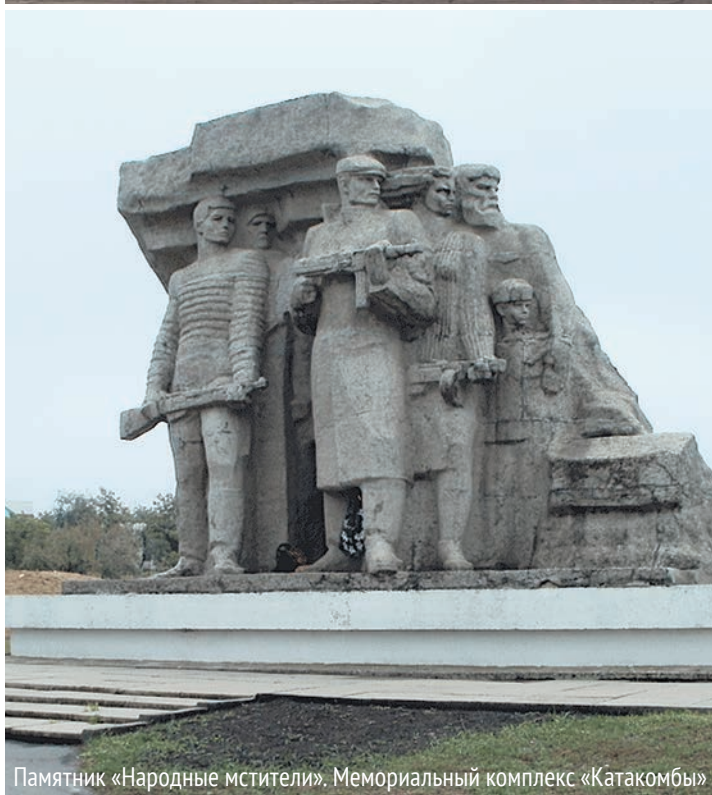
Памятник «Народные мстители». Мемориальный комплекс «Катакомбы»