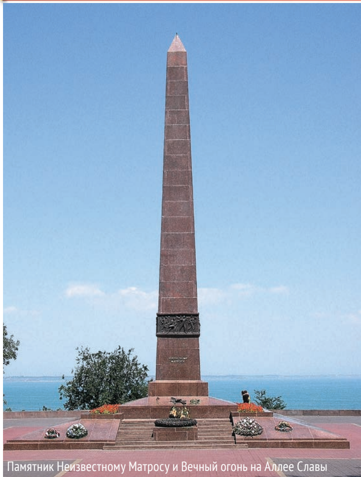
Памятник Неизвестному Матросу и Вечный огонь на Аллее Славы