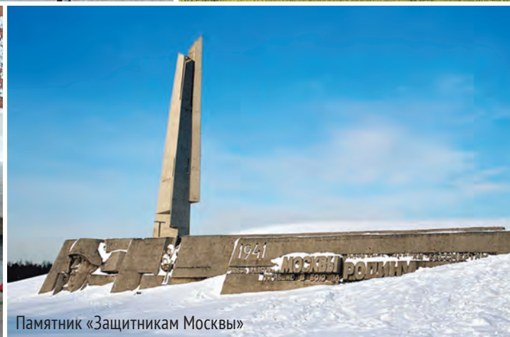
Памятник «Защитникам Москвы»