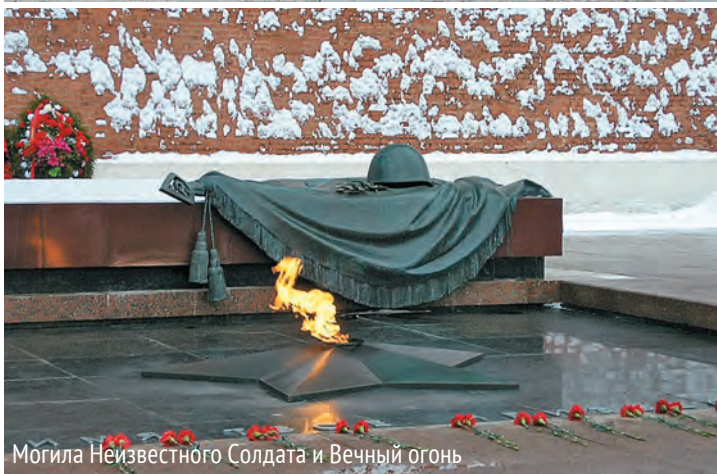
Мои́ла Неи́звестного Солдата и Вечный огонь