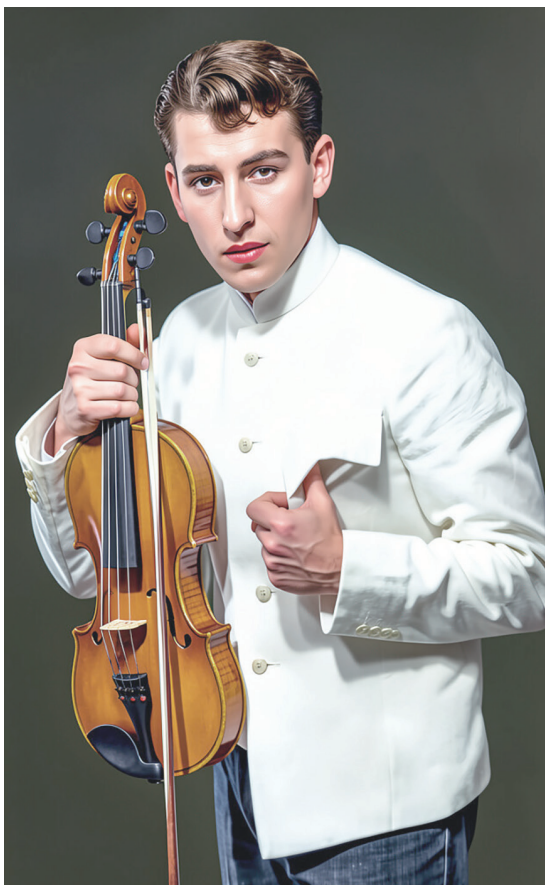
И. Дунаевский в 1914 г.

В 1910 г. семья Дунаевского переехала в Харьков. Там Исаак поступил в музыкальное училище, где осваивал скрипичное мастерство. Он продолжил обучение в Харьковской консерватории. Уже студентом стал много сочинять. Окончив консерваторию в 1919 г., Исаак Осипович устроился на работу в Харьковский драматический театр скрипачом-концертмейстером в оркестре, затем стал дирижером, а позднее — заведующим музыкальной частью театра. Там же он дебютировал как театральный композитор, сочиняя музыку ко всем новым спектаклям. Деятельность Дунаевского была обширной: он читал лекции о музыке и руководил армейской самодеятельностью, организовывал музыкальные студии и кружки при воинских клубах, заведовал музыкальным отделом губернского отдела народного образования и сотрудничал с газетами.