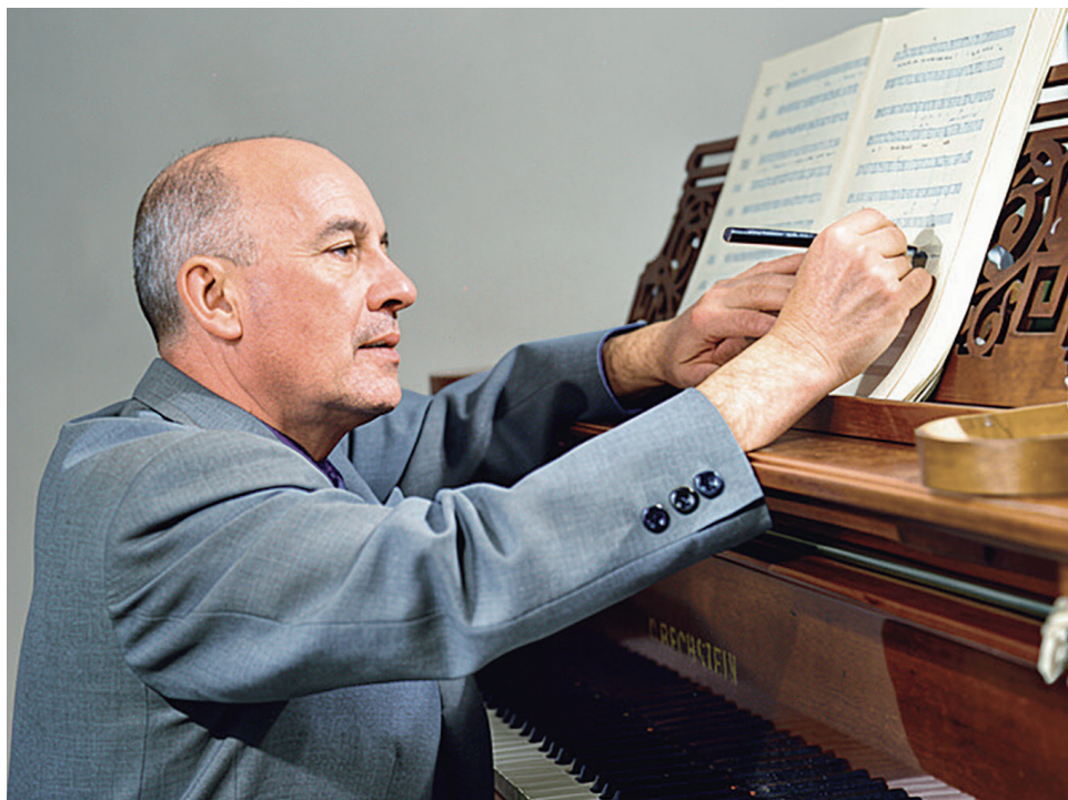
И. Дунаевский за работой

чески яркие вступления, интерлюдии между куплетами и даже отдельными музыкальными фразами.