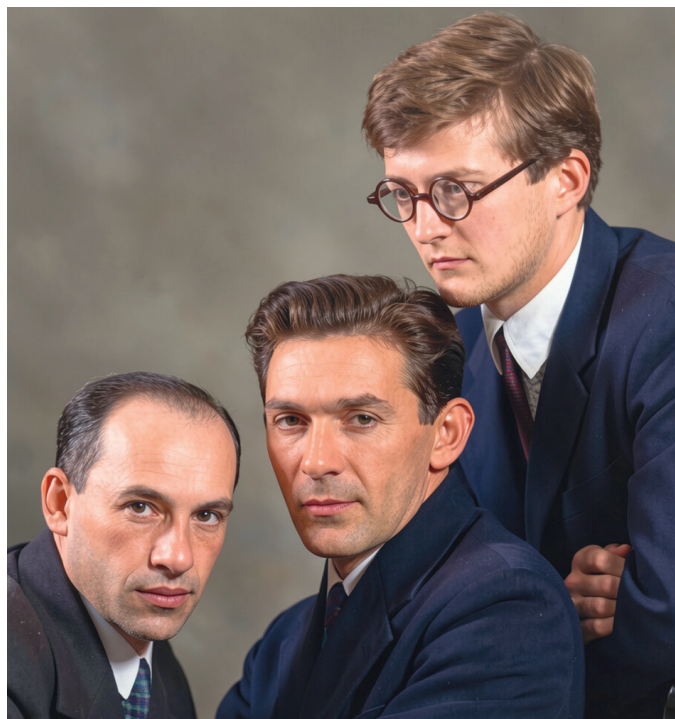
Д. Шостакович, Л. Утесов и И. Дунаевский в дни постановки в ленинградском Мюзик-холле, 1931 г.

В эти же годы начал сотрудничать с Леонидом Утесовым. В 1933 г. вместе с авторами Владимиром Массом и Николаем Эрдманом специально для бенефиса Л. Утесова композитор выпустил юмористическое джаз-обозрение «Музыкальный магазин», основой которого стали джазовые интерпретации мелодий Д. Верди, Н. Римского-Корсакова, П. Чайковского и других знаменитых классических авторов. В новой оригинальной редакции И. Дунаевского в Ленинградском мюзик-холле с успехом шла оперетта Ф. Эрве «Мадемуазель Нитуш» под названием «Небесные ласточки».