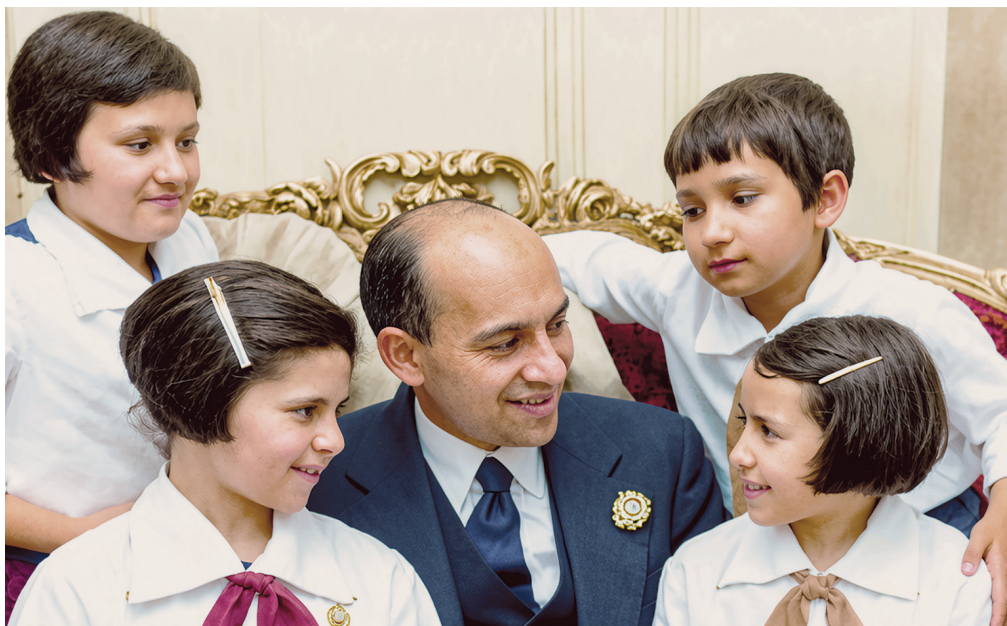
И. Дунаевский с танцевальной группой пионерского ансамбля в саду Дворца пионеров. 1940 г.

«Песенка о веселом ветре», сочиненная И. Дунаевским на слова В. Лебедева-Кумача, стала