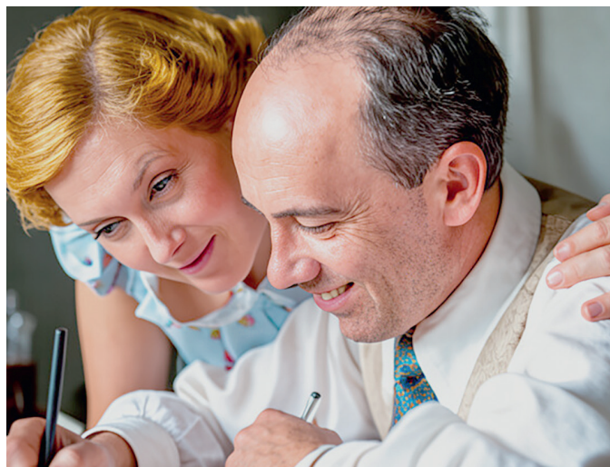
И. Дунаевский и Л. Орлова. 1937 г.

С 1934 по 1940 г. он сочинил музыку к шестнадцати кинофильмам. Также Исаак Осипович нередко участвовал в озвучании, играл на рояле и пел. Симфонический дар Дунаевского высоко ценил композитор Дмитрий Шостакович, а об оркестровом вступлении к кинофильму «Дети капитана Гранта» (1936) писал следующее: «Эта увертюра — симфоническое произведение большого накала и темперамента...» [1, с. 87]. Автор и сам считал это сочинение одним из лучших своих творений.