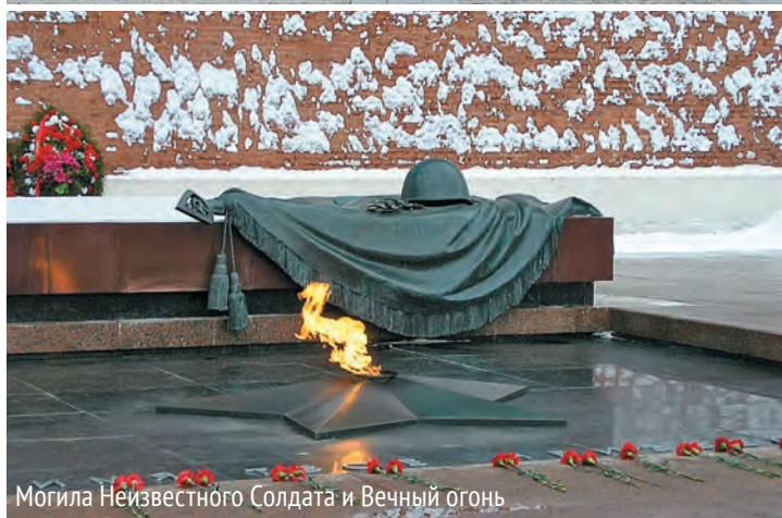
Могилы Неизвестного Солдата и Вечный огонь