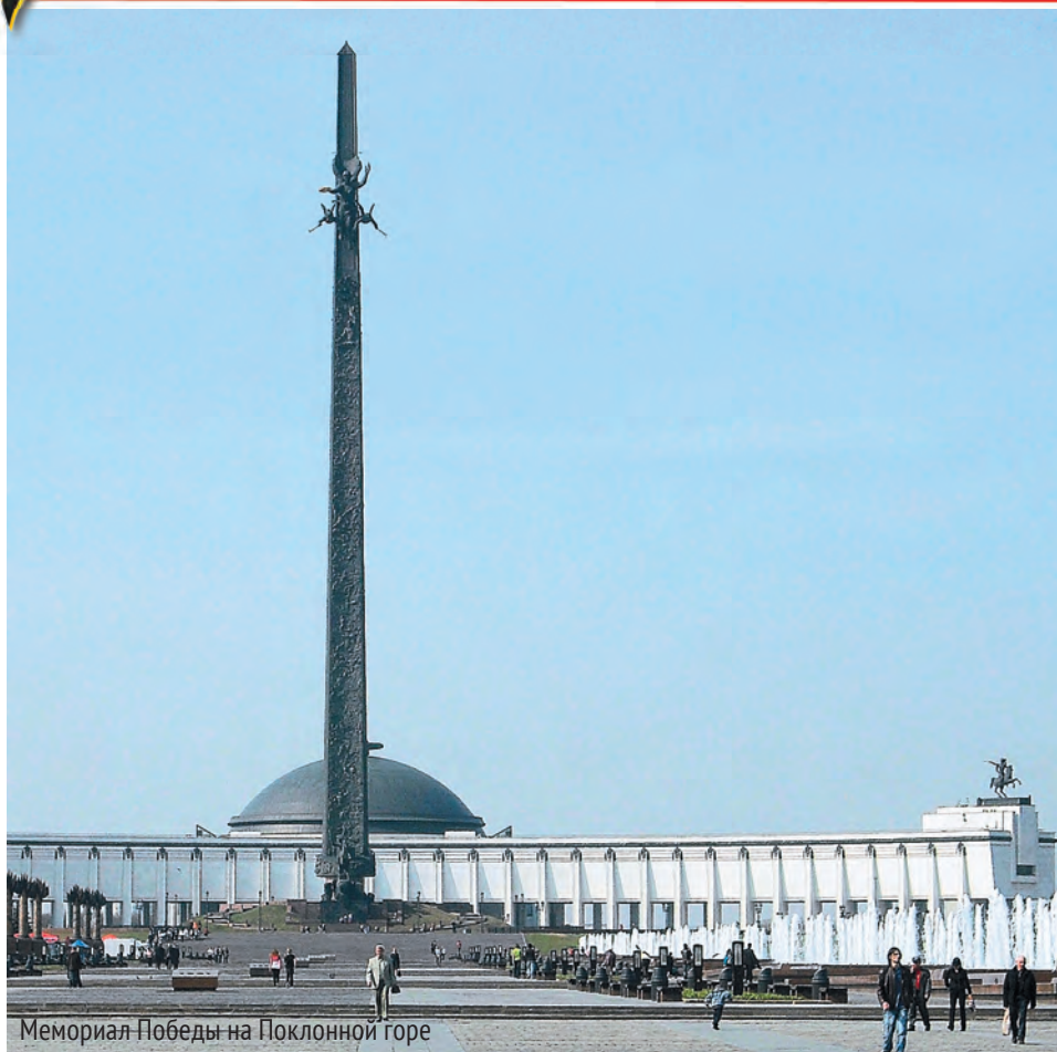
Мемориал Победы на Поклонной горе