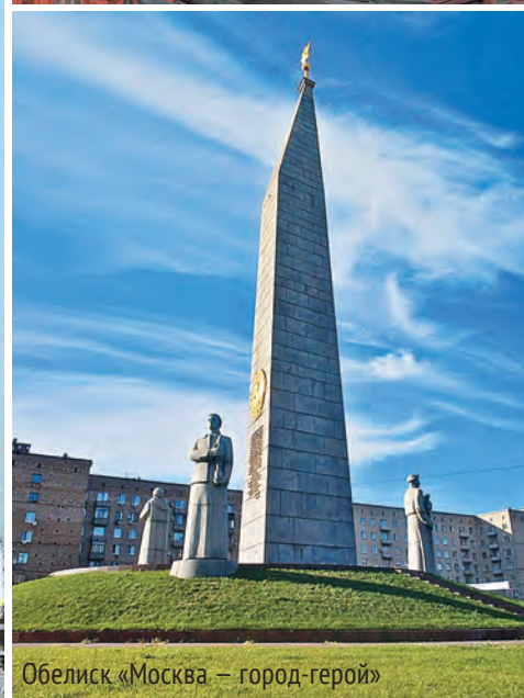
Обелиск «Москва – город-герой»