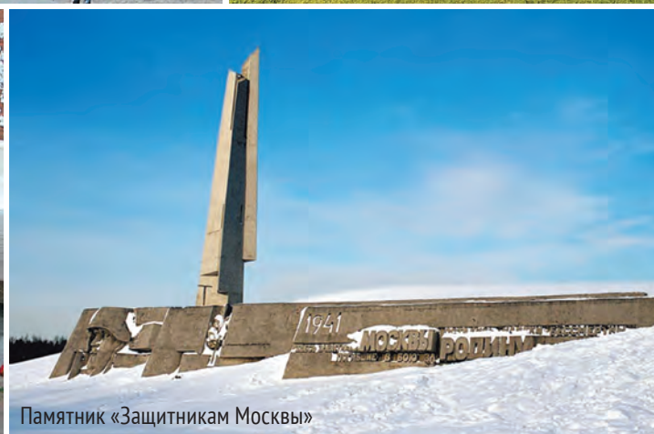
Памятник «Защитникам Москвы»