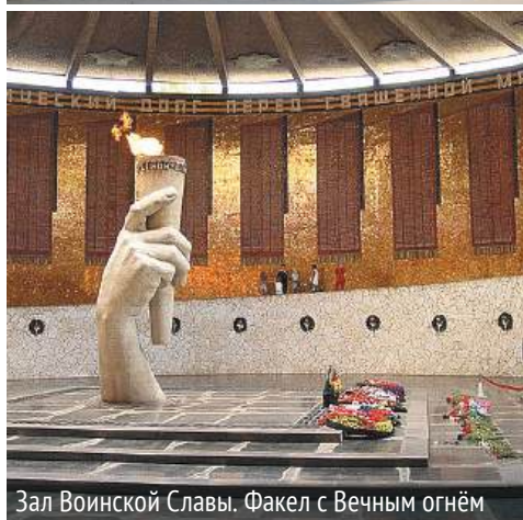
Зал Воинской Славы. Факел с Вечным огнём