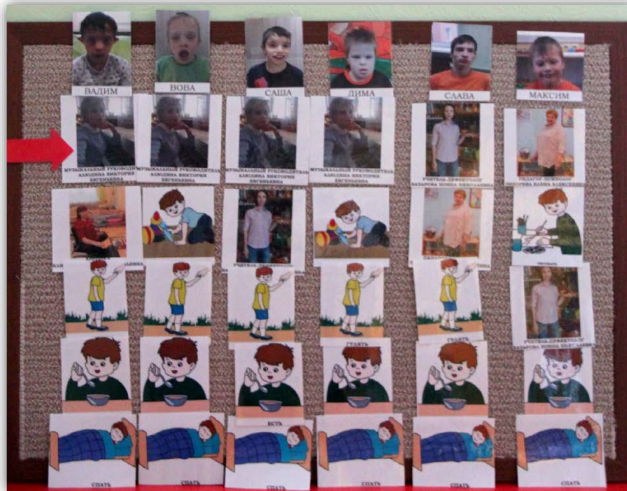
Индивидуальные расписания воспитанников на общем панно