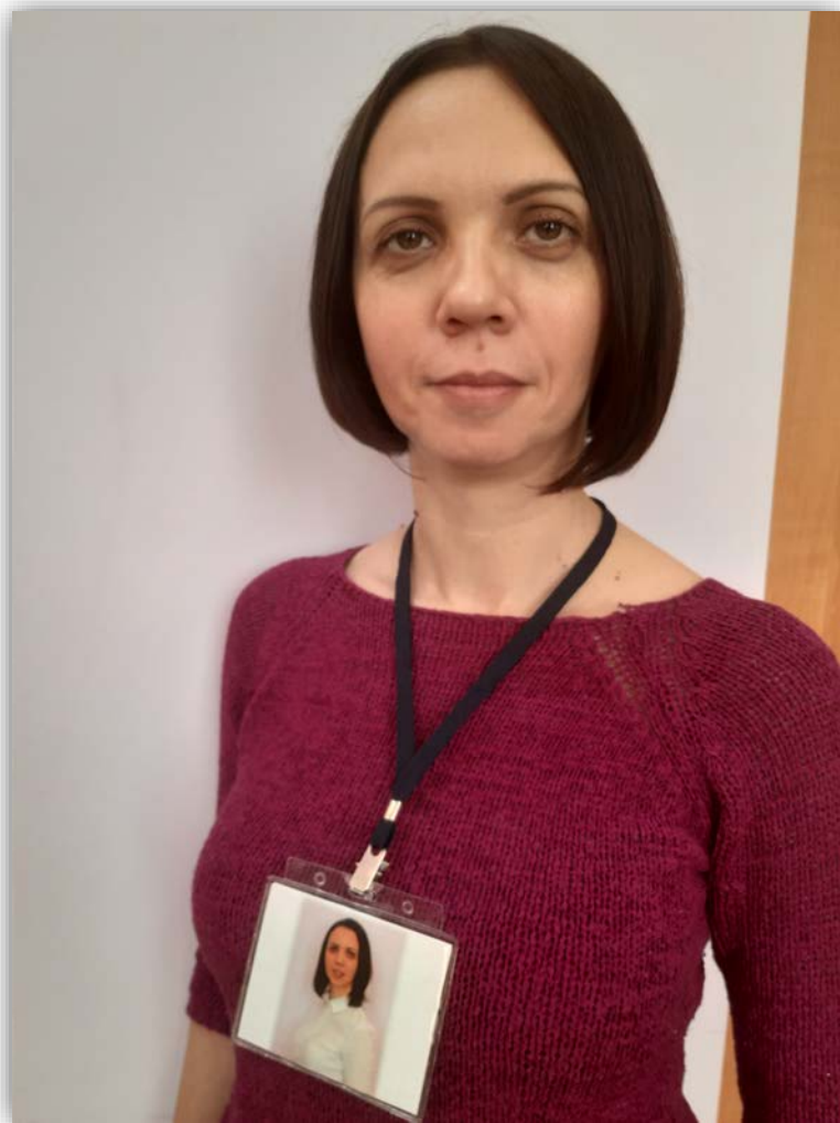
Бейдж с личным фото