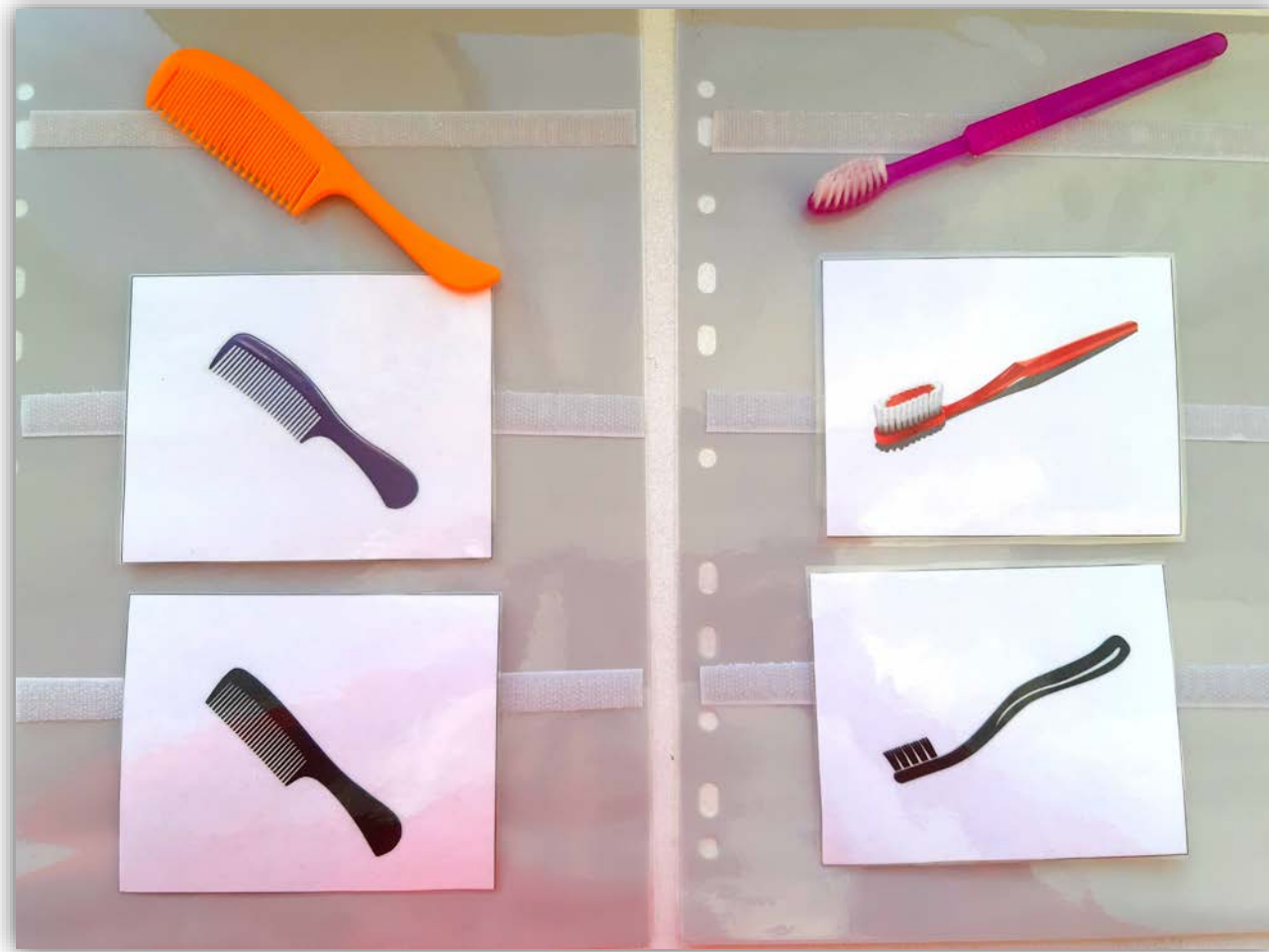
Предметное пособие по лексической теме: «Предметы гигиены»