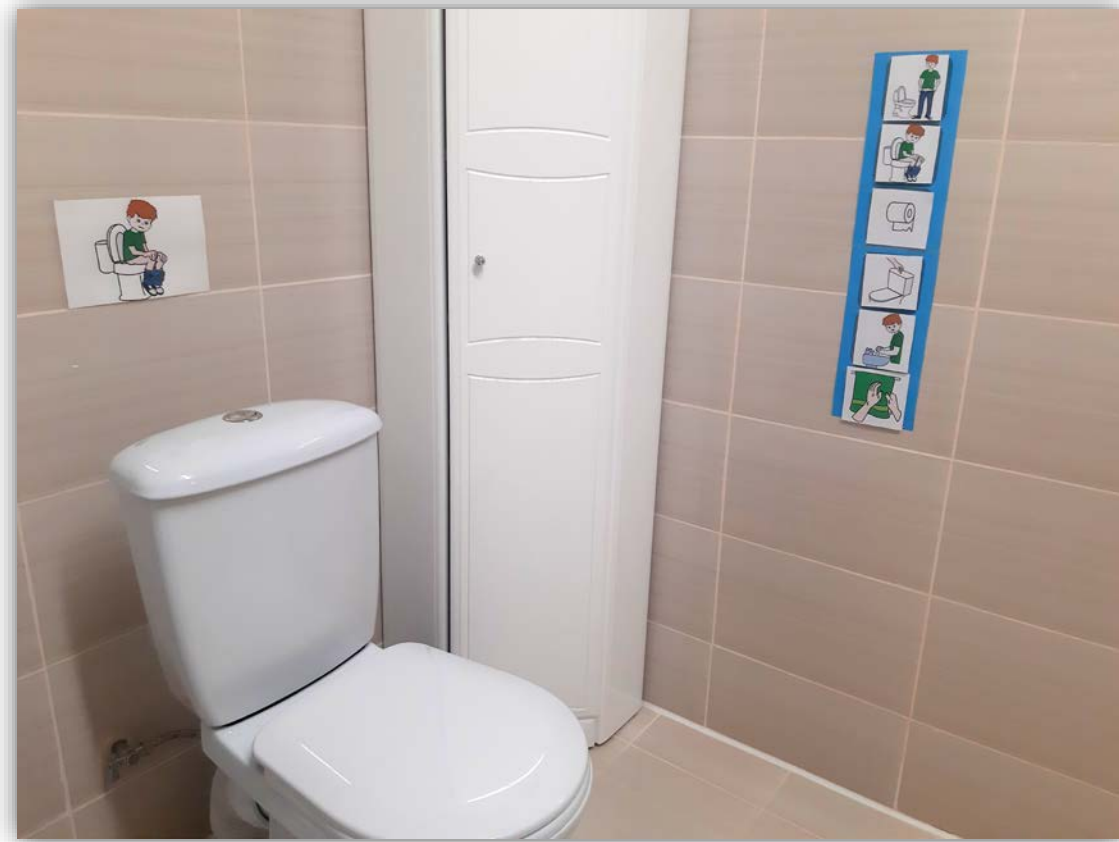
Алгоритм выполнения гигиенических процедур