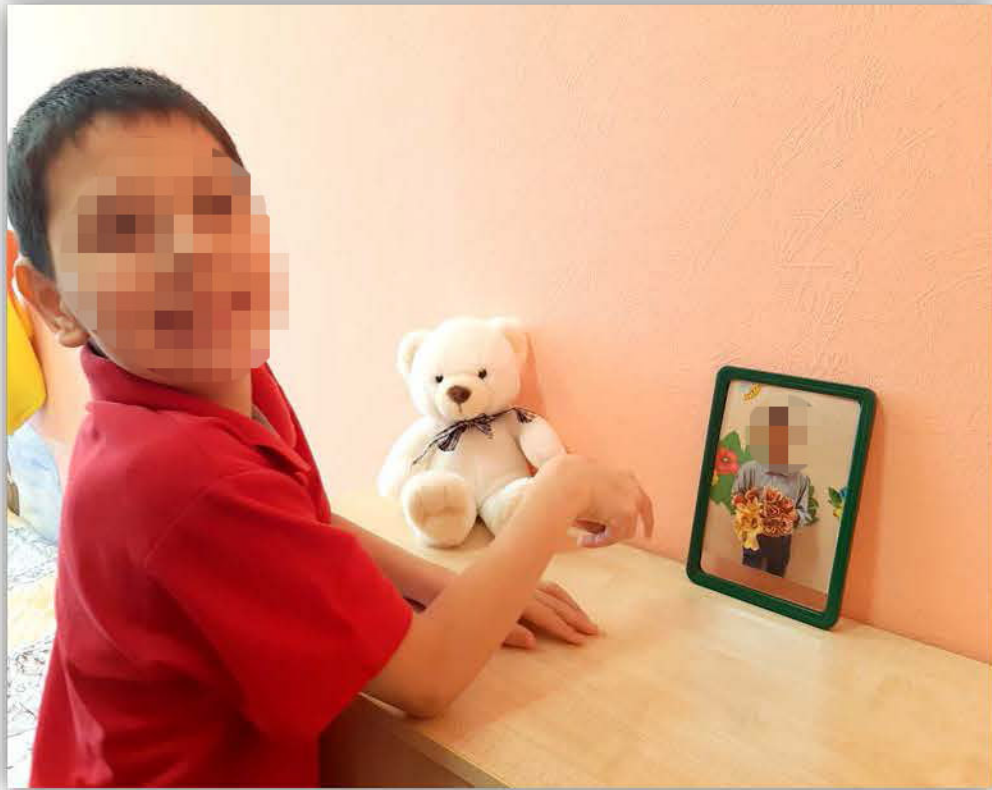
Личное фото воспитанника