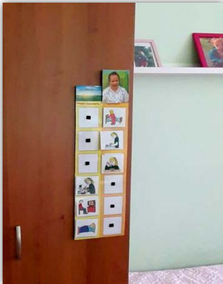
Индивидуальное расписание воспитанника