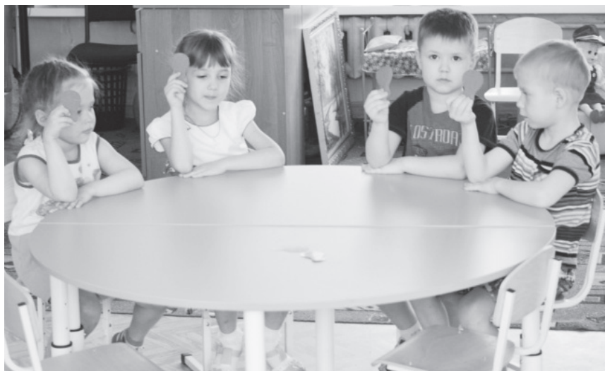
Фото. Команда «Ласточка»

На какой звук начинаются слова-названия команд?