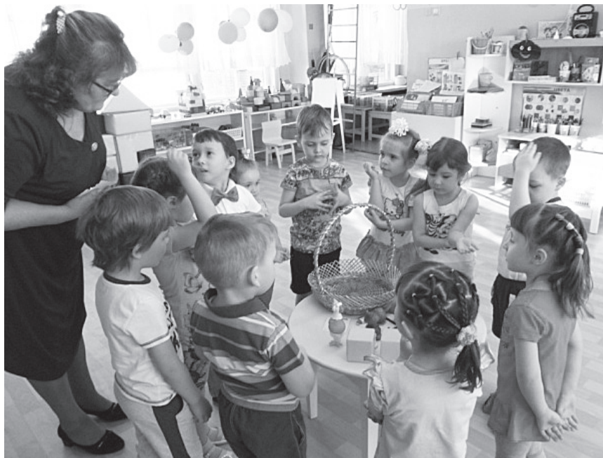
Фото. Игра «Хлопни, если услышишь песенку капельки»

Воспитатель. Пошла курочка по кругу и говорит начало слова. Кому на плечико сядет, тот словечко доскажет и повторит все слово: книж-ка, мыш-ка, соба-ка, игол-ка, рыб-ка, рубаш-ка, крас-ка, ябло-ко, солныш-ко, моло-ко, зай-ка, лей-ка, игруш-ка. Молодцы, правильно заканчивали и повторяли слова. Смотрите, наша тучка все еще хмурится, давайте ей песенку споем.