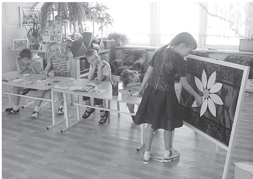
Фото. Игра «Ромашка»

Мы составили картотеку пословиц, рассказов и стихов, оформили словари.