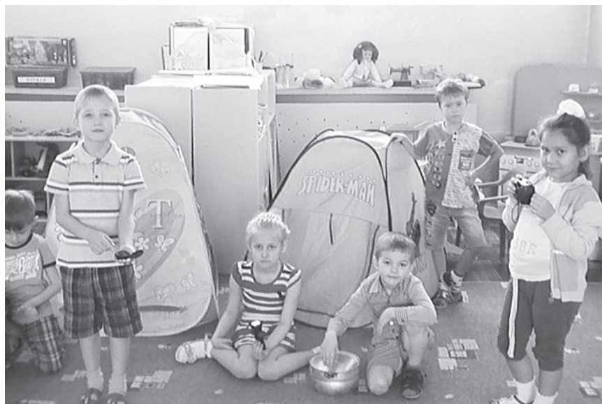
Фото 1. Самостоятельная игровая деятельность

Дети рассматривают картинки с изображением растений Забайкалья (венерин башмачок, купальница — жарки, иван-чай, одуванчики, черемша, багульник и др.) и называют их. Рассказывают, что из черемши, богатой витаминами, можно приготовить