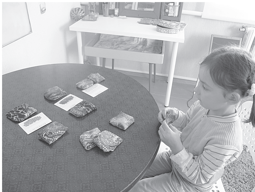
Фото 1. Игра «Мешочки с зернами»

рые приемы методики М. Монтессори становятся все более актуальными.