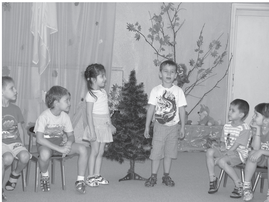
Фото 1. Дети читают стихотворение

Он мне скажет: порычи. Он попросит: помычи. Пошип и пожужжи И язык мне покажи. Хорошо пойдет беседа У меня и логопеда!