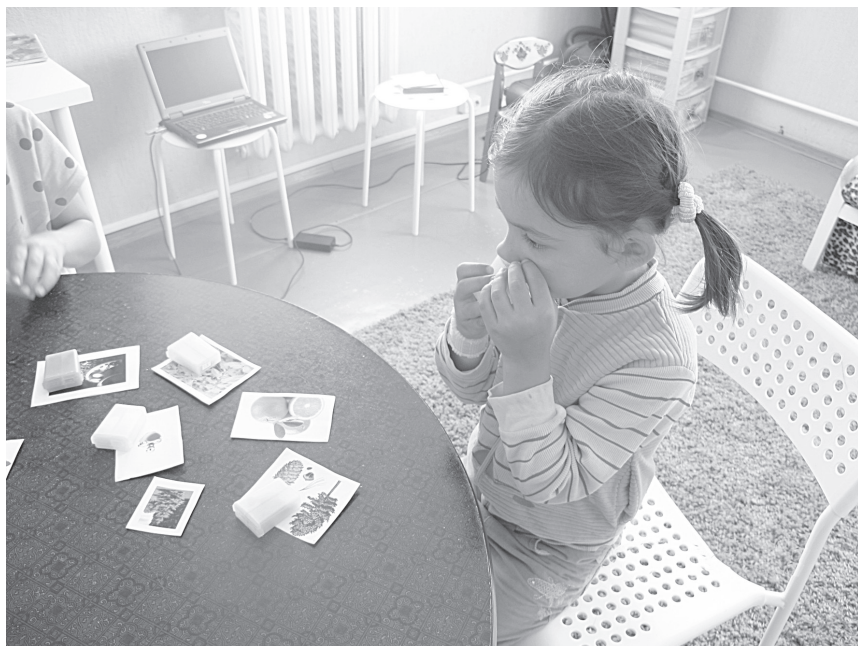
Фото 2. Игра «Коробочки с запахами»

Коррекционно-воспитательная: формировать мотивацию к обучению.