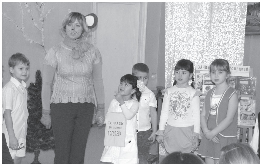
Фото 3. Заключительная часть занятия