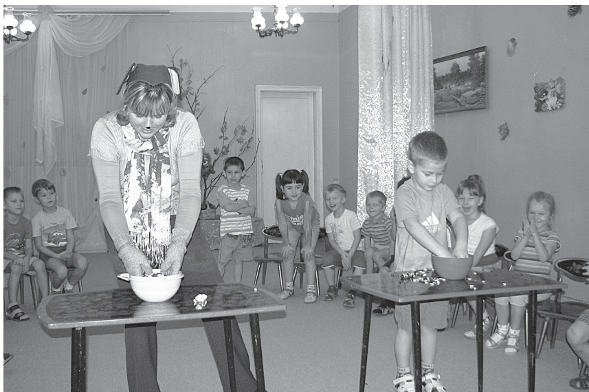
Фото 2. Пальчиковая игра