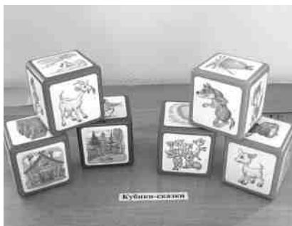
Фото 2. Кубики-сказки

произносительной стороны речи в связи с дизартрией, различной по форме и степени тяжести. Помимо нарушения произношения у большинства детей отмечается недоразвитие всех сторон языковой действительности: фонетики, лексики, грамматики, связной речи. Коррекционные задачи целенаправленно решаются специалистами на фронтальных и индивидуальных занятиях.