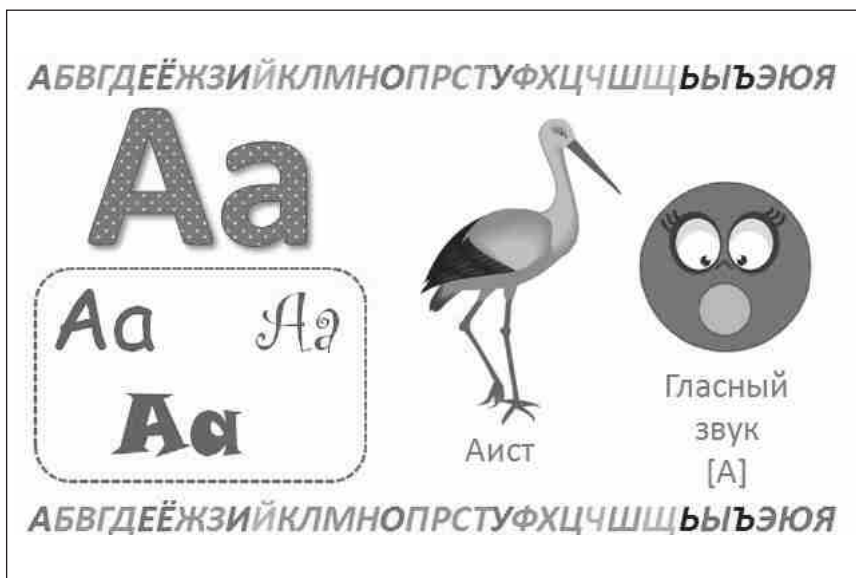
Рис. 1. Фрагмент тетради «Логопедическая азбука»