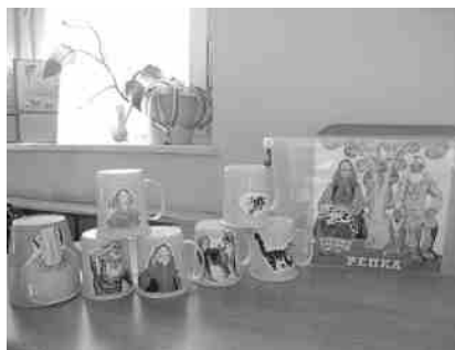
Фото 1. Оборудование для разыгрывания сказки «Репка»