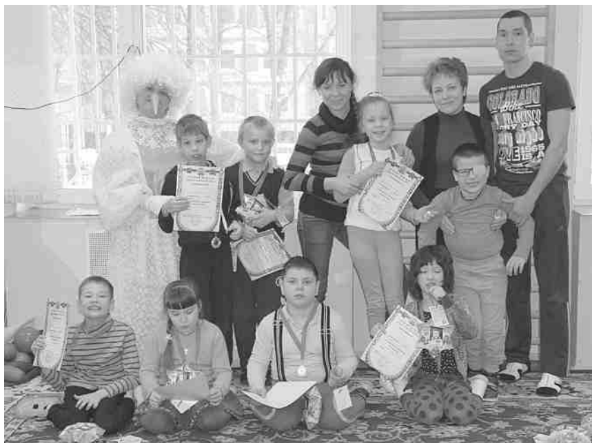
Фото 3. Итог занятия — награждение.