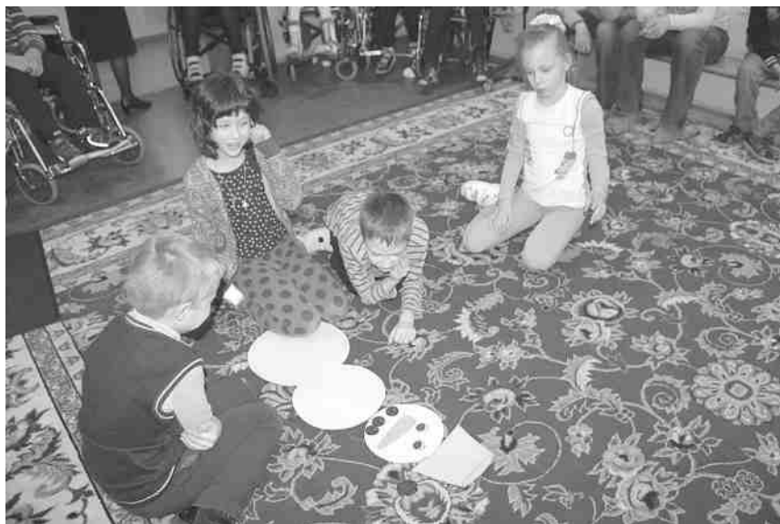
Фото 2. Составление снеговика

Послушайте, пожалуйста, шуточное стихотворение Д. Хармса, в котором есть загадка.