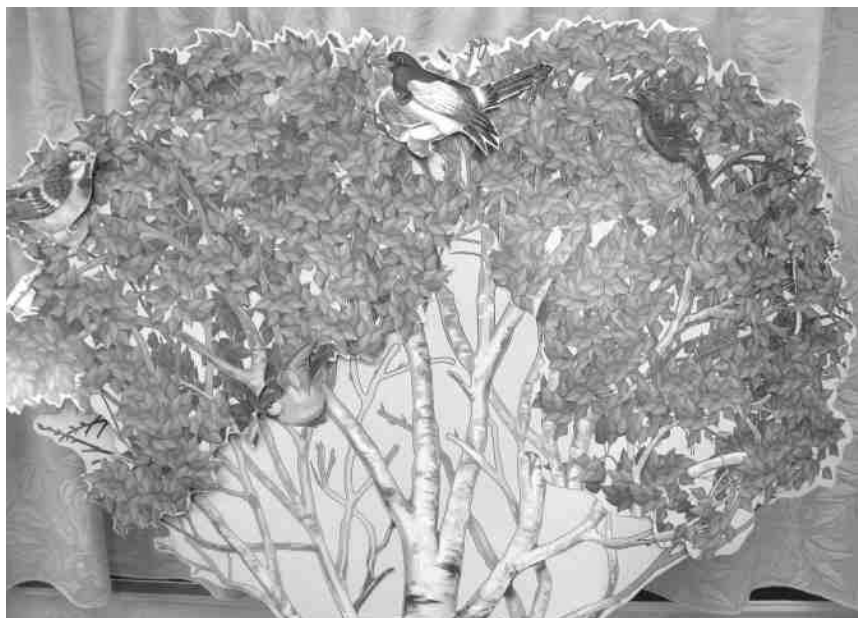
Фото. Интерактивное пособие «Березка познаний»

Для активизации взаимодействия семьи и специалистов ДОО мы создали интерактивное пособие «Березка познаний» (см. фото). Оно представляет собой цветные конвертики с играми и заданиями. «Березка познаний» может использоваться как наглядное пособие на занятиях дефектолога по ознакомлению с окружающим миром, развитию элементарных математических представлений, на занятиях логопеда по развитию речи, а также воспитателя в различных видах деятельности. Его можно легко переносить и модифицировать.