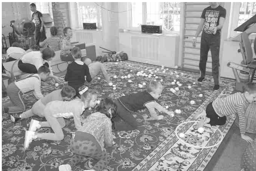
Фото 1. Задание «Попади снежком в цель»

Учитель физкультуры. Ребята, у вас отлично тренированы руки!