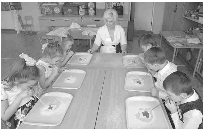
Фото 1. Игра «Дуем через трубочку»

Здесь у нас стоят подносы. Что в них особенного?