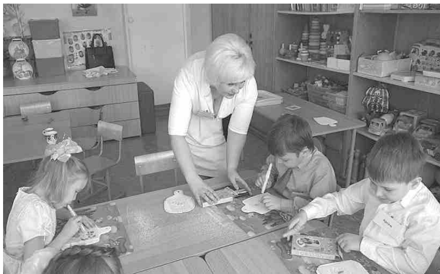
Фото 2. Декорирование разделочных досок