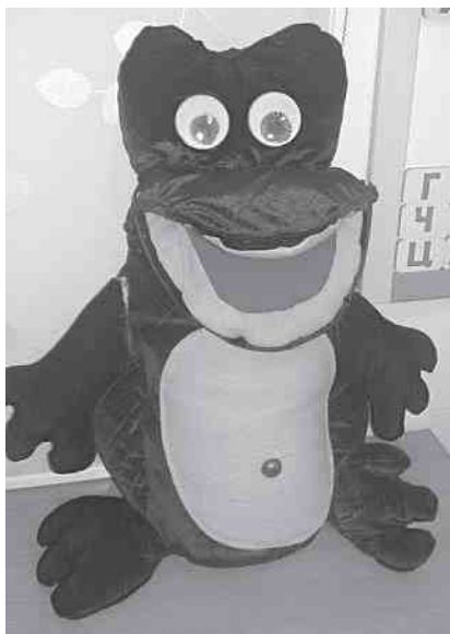
Фото. Логопедическая игрушка Лягушка Клава

Но на этом работа не заканчивается! Поставленный звук нужно закрепить, научить ребенка произносить его изолированно, затем в слогах, словах, словосочетаниях, предложениях и т.д. и только потом ввести его в спонтанную речь. И это только один звук. А если их пять? Девять?