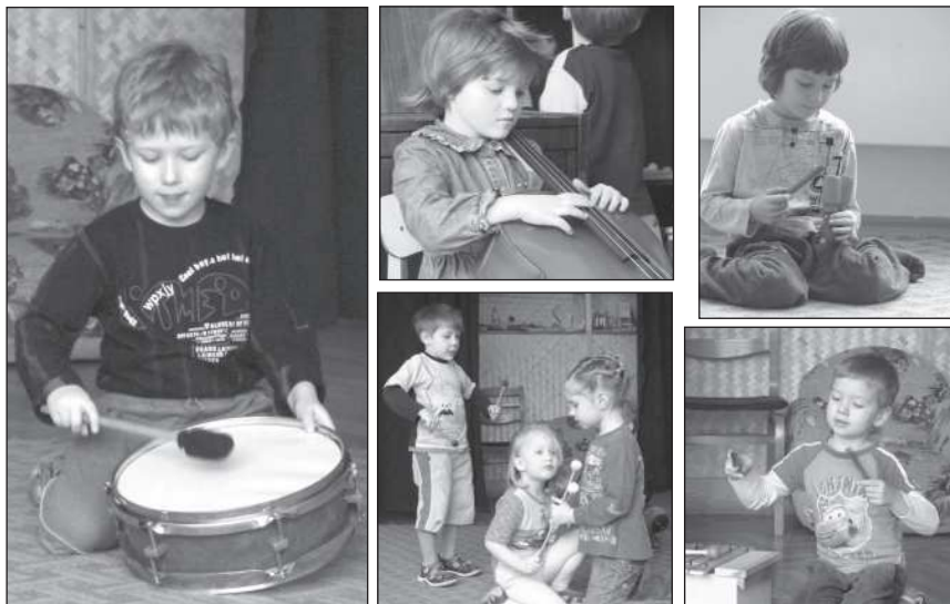
На занятиях «Оркестра»