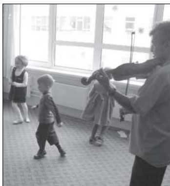
На занятиях «Оркестра»