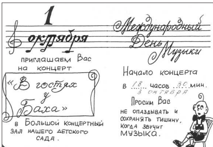
Пригласительный билет в «Большой концертный зал детского сада»