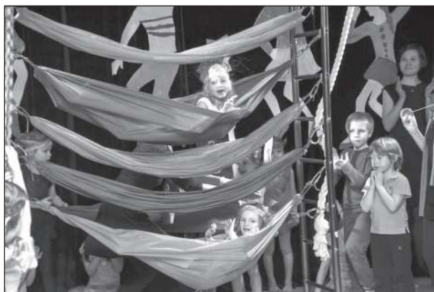
Из трюков «эльфийского цирка»