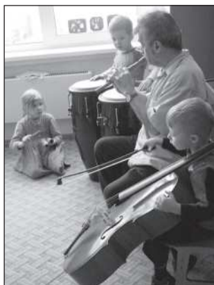
На занятиях «Оркестра»

Умничка. Это знак молчания. Поэтому в паузу мы рот прикрываем ладошками.