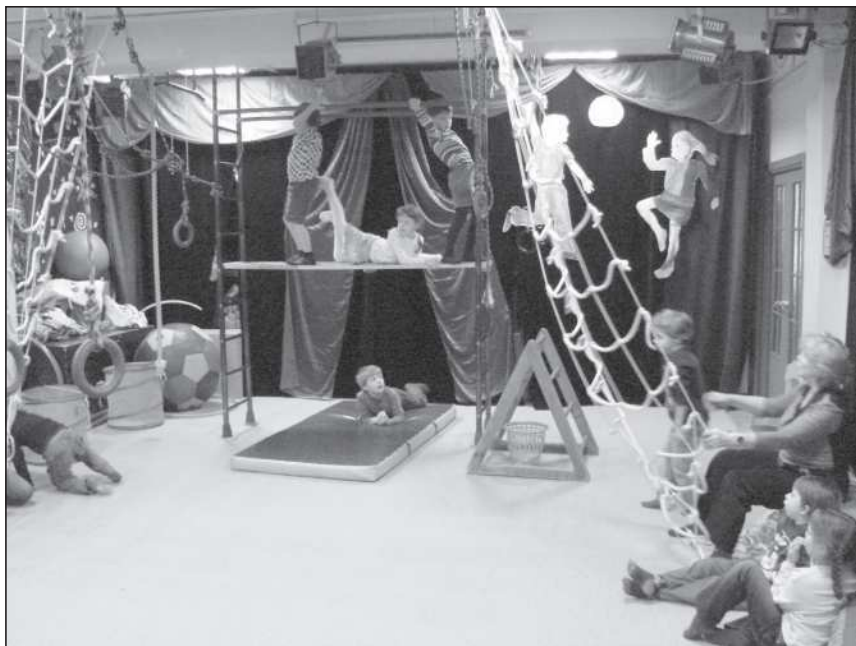
На цирковой репетиции