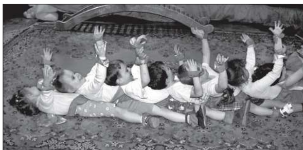
«Цирк». Во время представления

Таким образом, детям оказалась не нужна специальная подготовка, чтобы попасть на праздник: не нужно выучивать слова соответственно своей речи, не надо, волнуясь, вспоминать стихи при большом количестве народа. На таких праздниках стали чувствовать себя комфортно не только дети, но и воспитатели, которые перестали следить за сценарием, а стали просто играть, превращаясь в героев сказки, а слова сочинялись на ходу и дети участвовали в живом разговоре, действие разворачивалось с их помощью.