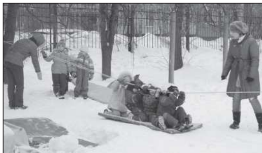
На зимней олимпиаде