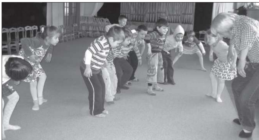
На занятиях по пластике