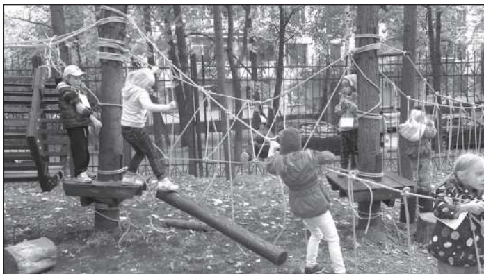
Панда-парк в действии

Само устройство детского маршрута не казалось сложным. Достаточно было найти людей, «умеющих вязать морские узлы», а такие люди есть среди наших родителей! Но где взять хоть и уменьшившуюся раз в три, но все-таки существенную по меркам нашего садика сумму?