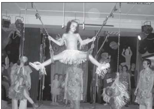
«Цирк». Во время представления