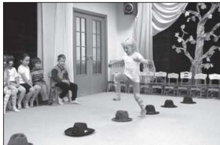
На занятиях по музыкальному движению