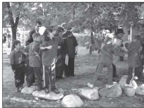
На весенней олимпиаде

После прохождения всех этапов команды вновь собираются вместе и получают заслуженный приз и, радостные и гордые собой, несут его в группу.