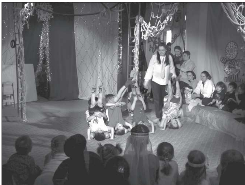
На арене «цирка»

На цирке всюю затребованы такие качества, как умение слышать—видеть—чувствовать другого, т.е. командная работа. Можем ли мы вместе что-то сотворить? И что мы можем вместе, и какой вклад каждый вносит в общее дело, а главное — получаем ли мы удовольствие от хорошей совместной работы?